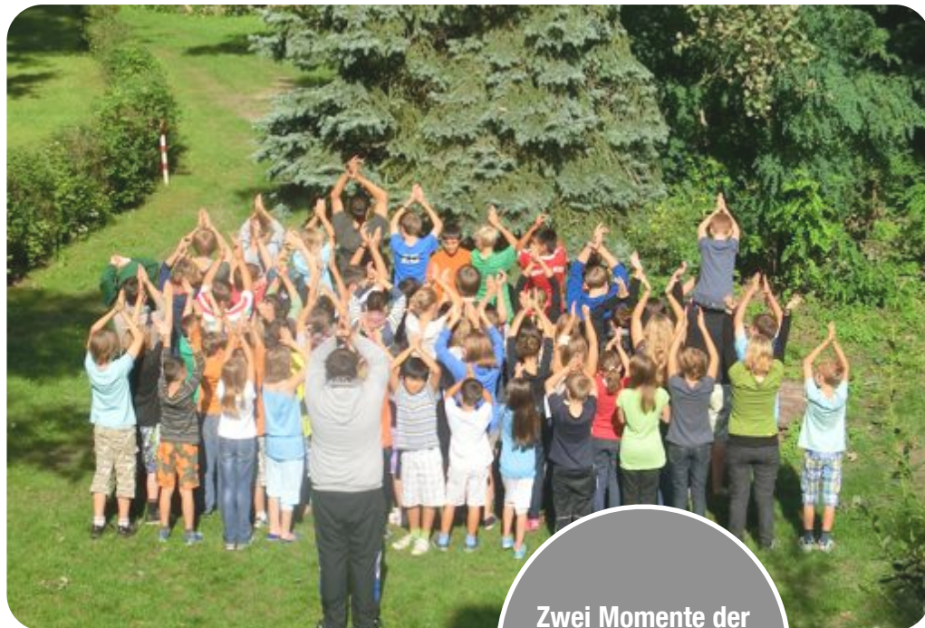
Zwei Momente der etwa zehnmütigen Prozedur