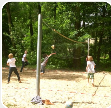
Die Kinder zeigen vollen Einsatz

Ob das Trainingsprogramm so viel geholfen hat, lässt die Redaktion offen