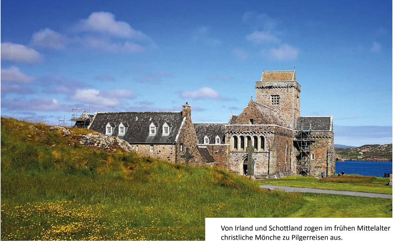
Von Irland und Schottland zogen im frühen Mittelalter christliche Mönche zu Pilgerreisen aus.

St. Jakobi und auch Bewegungen wie „Fresh X“ ein Symposium dazu für kommenden Oktober vorbereitet.