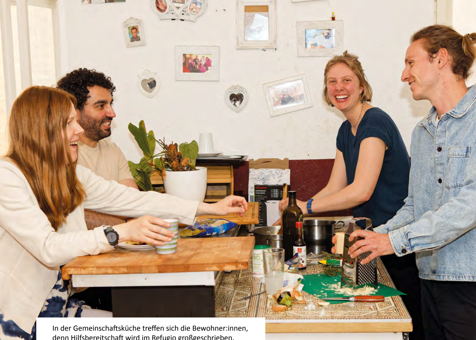
In der Gemeinschaftsküche treffen sich die Bewohner:innen, denn Hilfsbereitschaft wird im Refugio großgeschrieben.