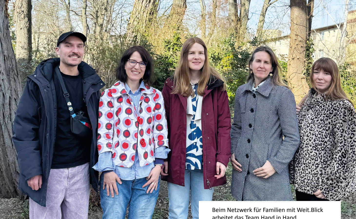
Beim Netzwerk für Familien mit Weit.Blick arbeitet das Team Hand in Hand.