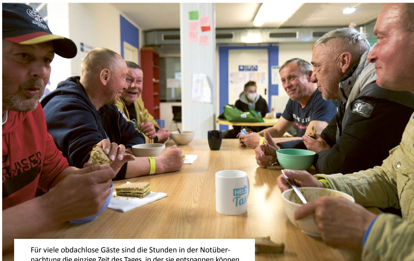
Für viele obdachlose Gäste sind die Stunden in der Notübernachtung die einzige Zeit des Tages, in der sie entspannen können.