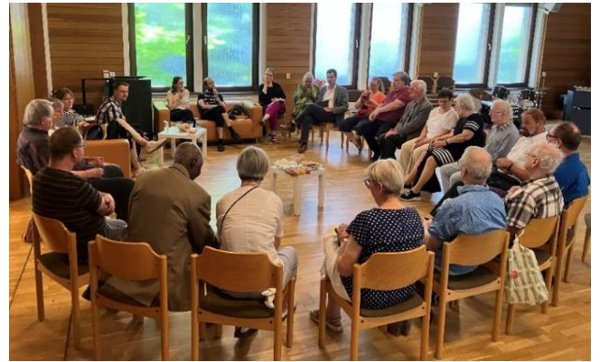
Gemeinde im Gespräch