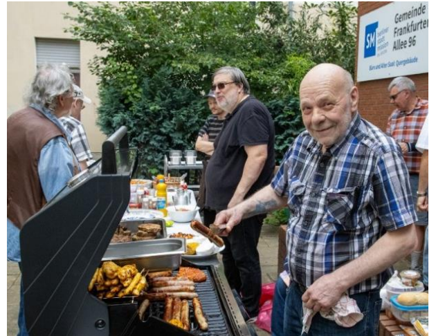
Leckereien vom Grill