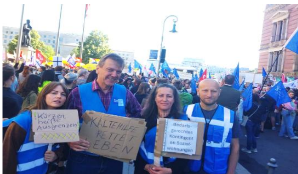
Demo gegen Sozialabbau

Der Berliner Senat plant massiv Gelder im sozialen Bereich einzusparen. Dagegen formiert sich Widerstand. Vor dem Abgeordnetenhaus wurde